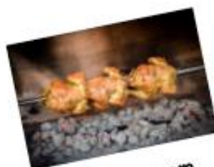
Brathuhn vom Holzgrill