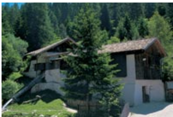
Das Naturparkhaus Steger Säge

Der Naturpark Schlern-Rosengarten wurde 1974 gegründet und umfasst 6.796 ha, aufgeteilt auf die Gemeinden Tiers , Völs am Schlern und Kastelruth . Seit seiner Erweiterung 2003 gehört neben dem Schlern auch der Rosengarten zum Park. Der Naturpark Schlern war der erste vom Land Südtirol ausgewiesene Naturpark. Älter ist nur der 1951 gegründete Nationalpark Stilfser Joch .